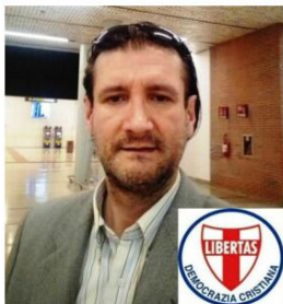
A cura di Dott. GUIDO SAVIO (Padova)

guido.savio@dconline.info * Cell. 350-1217201 *