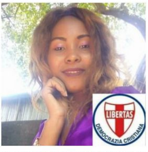
A cura della Dott.ssa CLEMENTINE HENRIETTE

yenny.gonzales@dconline.info) ha inteso formulare alla nuova Dirigente della D.C. in Bulgaria i più cordiali auguri di <Buon lavoro > e di < Buona D.C. >!